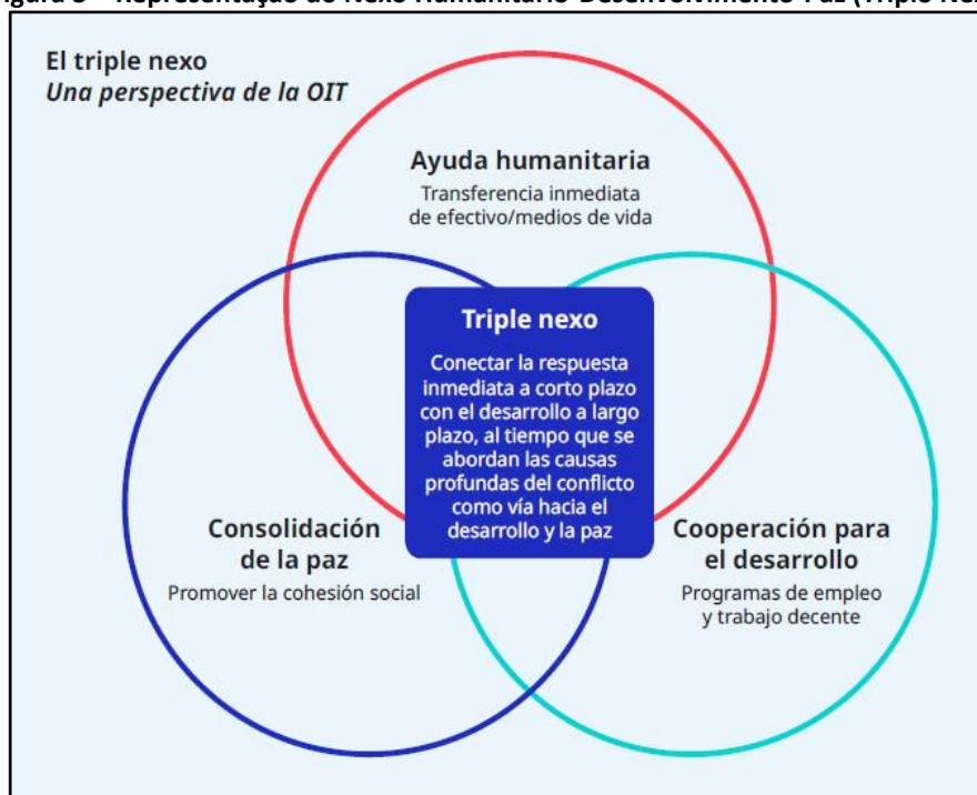
Figura 3 – Representação do Nexo Humanitário-Desenvolvimento-Paz (Triplo Nexo)