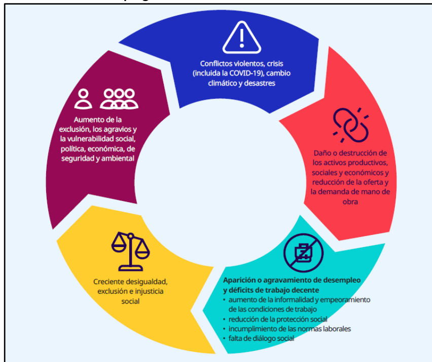
Figura 1 – Círculo vicioso de situaciones de crisis que incluyen conflictos, desempleo e escasez de mão de obra